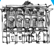
Palazzo Bianco (Comune)